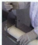
手作業による裁断