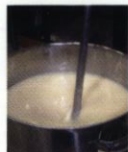
熟練の技術者による攪拌

本製品は自然製法にこだわり、手づくり自然乾燥にて製造を行っております。その製法を粹練り、コールドプロセス製法(外から熱を加えない製法)といい、原料の有効成分を壊すことなくそのまま閉じ込めることができます。