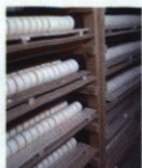
自然乾燥庫で熟成