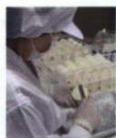
人の手による磨き